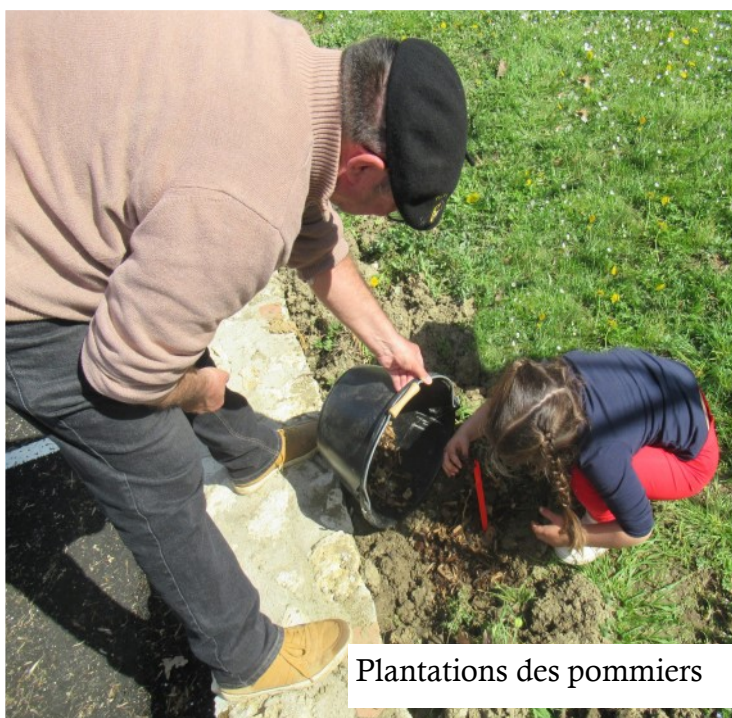
Plantations des pommiers