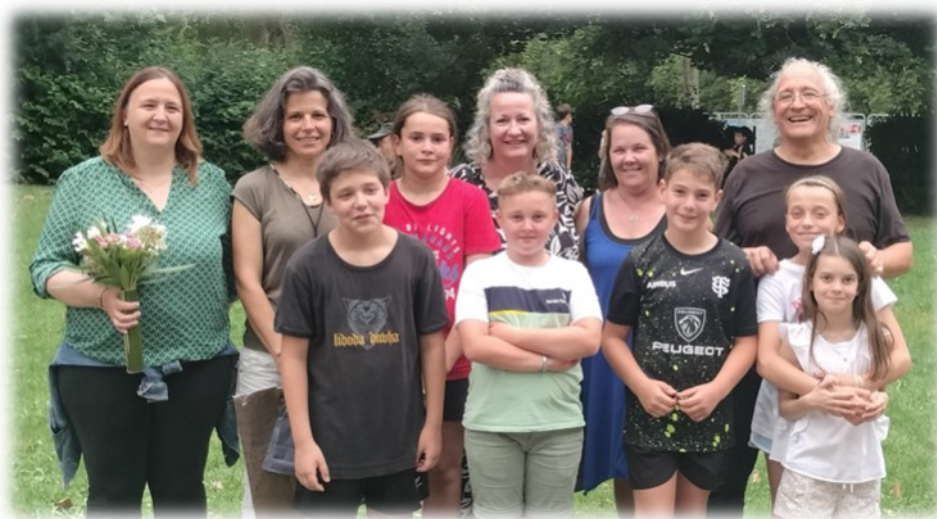
Photo d'adieu pour les CM2

Fin d'année scolaire, les deux écoles, la maternelle de Cassaigne et le primaire de Mouchan se sont retrouvés à l'école Pierre Gabriel. Petits et grands ont fêté leurs enseignants et les personnels qui interviennent dans les écoles.